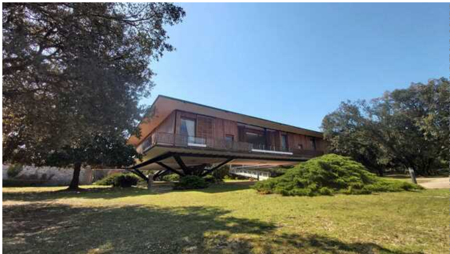
La Villa del Gombo

Nasce alla Villa del Gombo, ex residenza del Presidente della Repubblica all'interno del Parco di San Rossore, la Scuola di Educazione Civica. L'iniziativa è in programma da giovedì 21 a sabato 23 settembre e si rivolge a quaranta studentesse e studenti all'inizio del quinto anno delle scuole medie superiori, selezionati in base al merito scolastico, al contesto di possibile fragilità sociale ed economica e alla motivazione personale verso i temi dell'educazione civica. Ideata da un gruppo di allieve e allievi ordinari della Scuola Superiore Sant'Anna con il coordinamento scientifico di Luca Gori, ricercatore di Diritto costituzionale, la prima edizione del progetto è costruita attorno al tema 'Raccontare la realtà che cambia'.